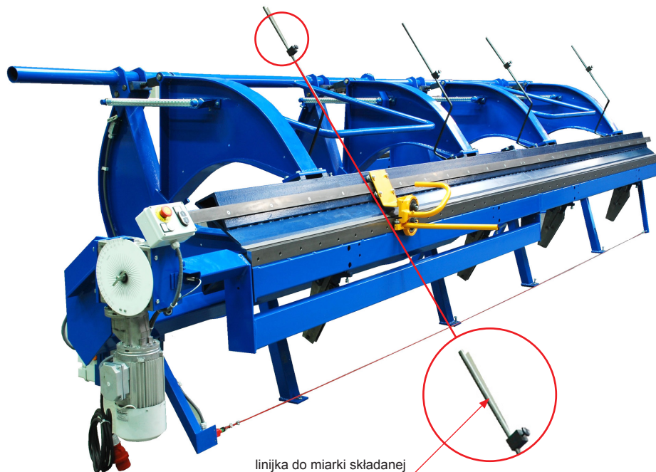
linijka do miarki składanej