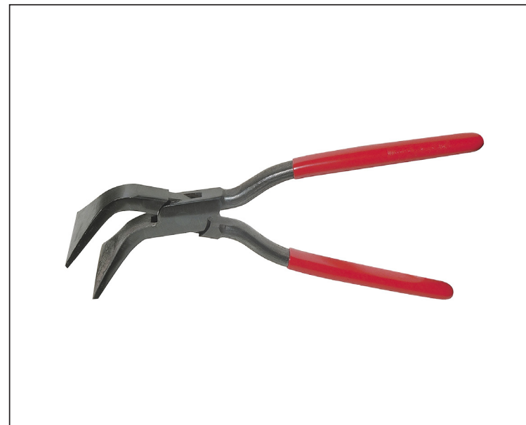
Stal węglowa C45