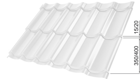
L – DŁUGOŚĆ OPTIMALNA POKRYCIA DLA MODUŁU 350 mm