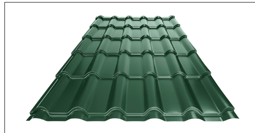
L – DŁUGOŚĆ OPTIMALNA POKRYCIA DLA MODUŁU 350 mm