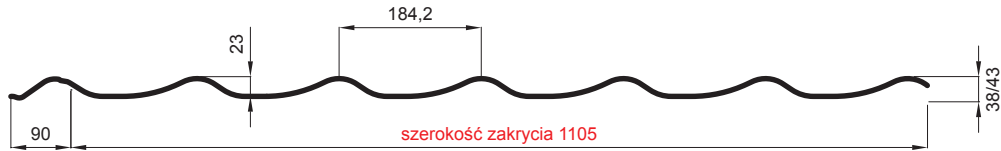
L – DŁUGOŚĆ OPTIMALNA POKRYCIA DLA MODUŁU 350 mm